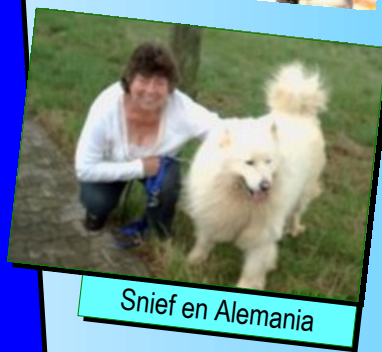
Snief en Alemania